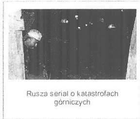
Rusza serial o katastrofach górniczych