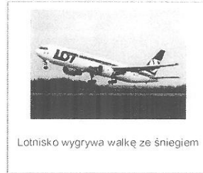
Lotnisko wygrywa walkę ze śniegiem