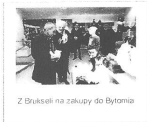
Z Brukseli na zakupy do Bytomia

Aktualności Wydarzenia Multimedia Blogi Katalog firm Kto jest kim Szkolenia Newsletter